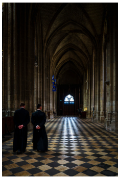
1ste prijs publieksjury Toon Smits